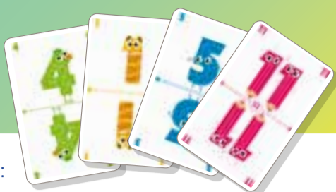
Illustration: Alena Istif Design: Florentyna Butler, Gisela Kösler (Spielanleitung) Art Direction: Chiara Bellavite Redaktion: Tina Landwehr, Karoline Weber & Verena Weber

80 Zahlenkarten in 4 Farben mit den Zahlen von 1 bis 20.